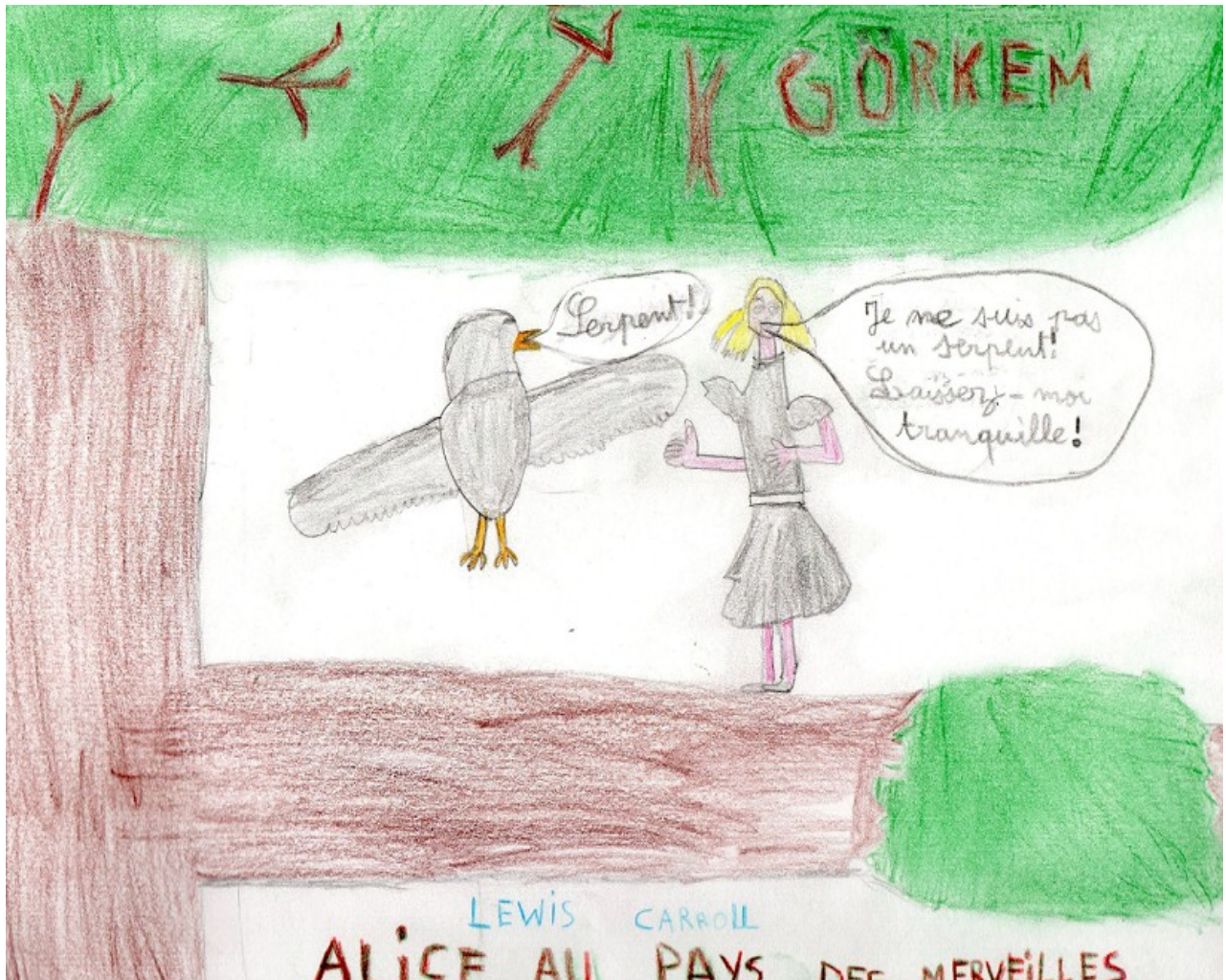
Couverture réalisée par Görkem.