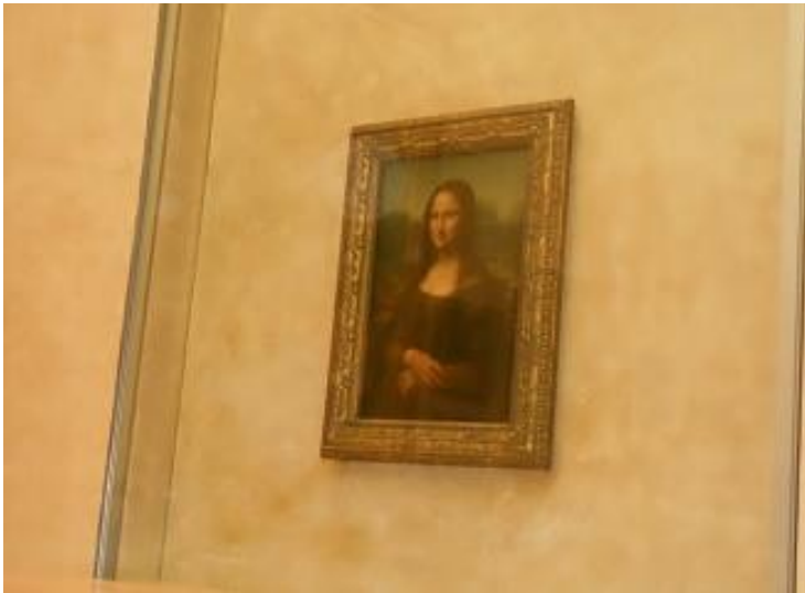
« La Joconde », la vedette du Louvre...