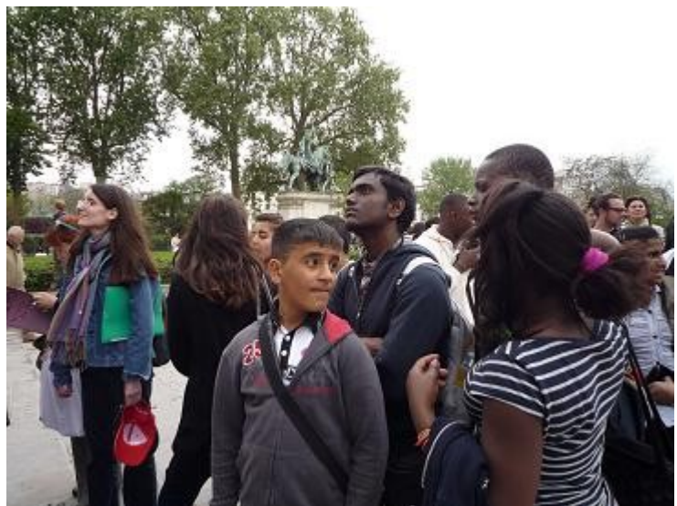
Entre extase et interrogation (tu aimes toi ?...)