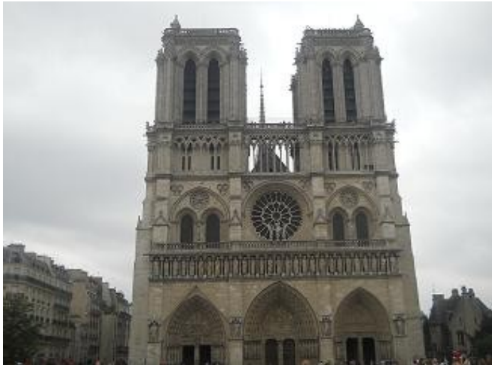
Bella, bella, Notre-Dame ...