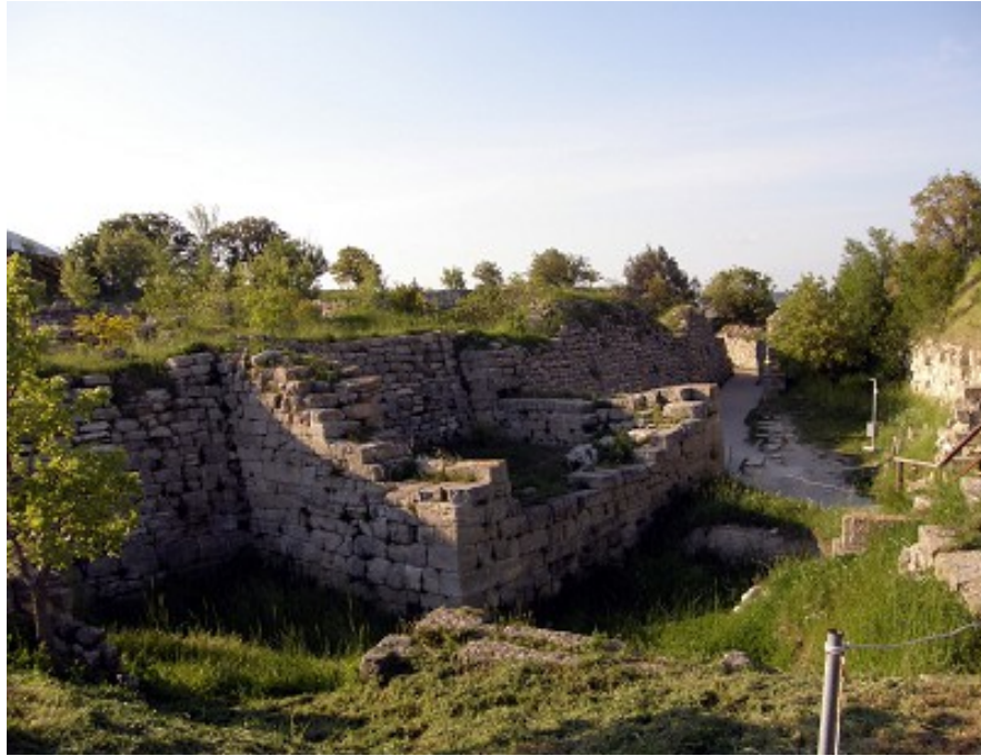
Entrée de l'ancienne ville de Troie