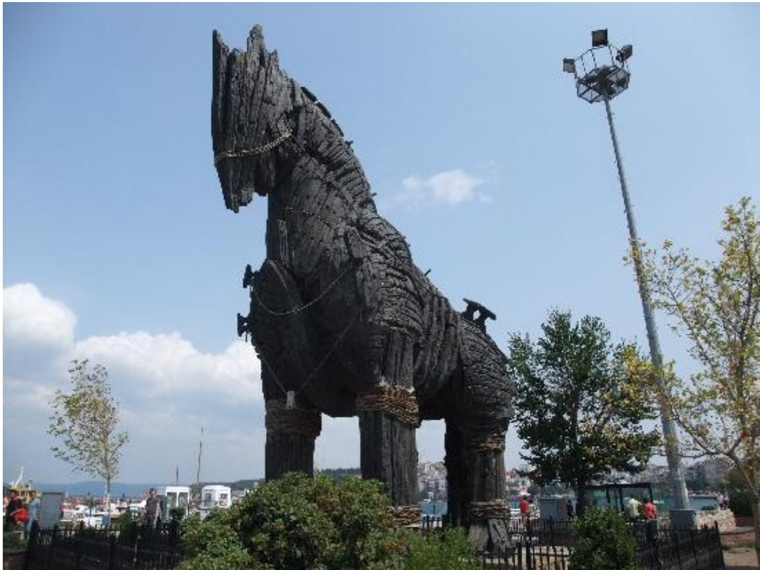
Le Cheval de Troie reconstitué, à Çannakale