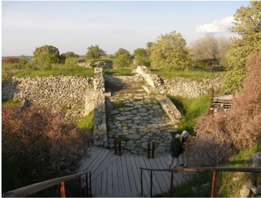
La rampe pavée pour accéder à la citadelle